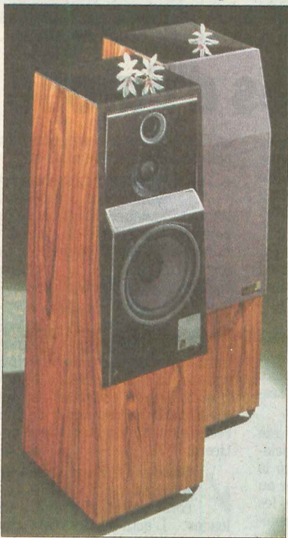
Une enceinte Jean Maurer 325D: un bijou à 3475 francs pièce destiné aux audiophiles avertis. Maurer